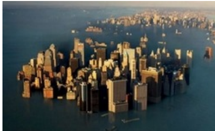
Vue d'artiste de New-York sous les eaux

Le but de cet exercice est d'évaluer l'évolution du niveau des océans en lien avec l'augmentation de la température de l'atmosphère terrestre.