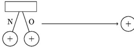
Figure 2. Règle de réduction pour les arbres de décision binaire